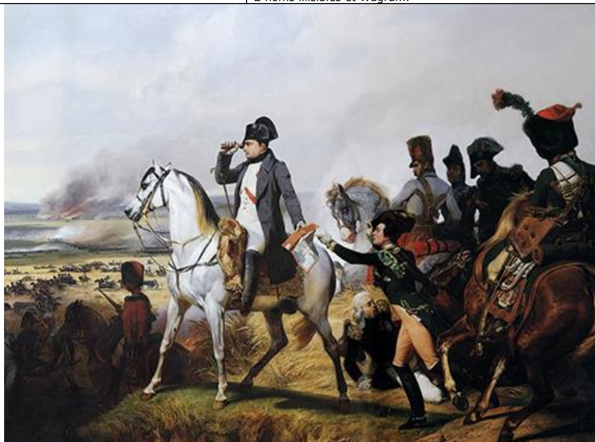
Napoléon à Wagram, le 6 juillet 1809