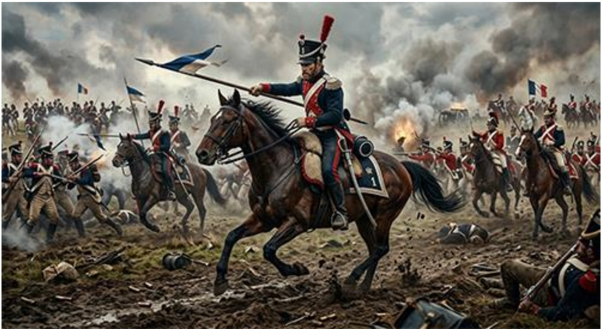
La charge des voltigeurs.