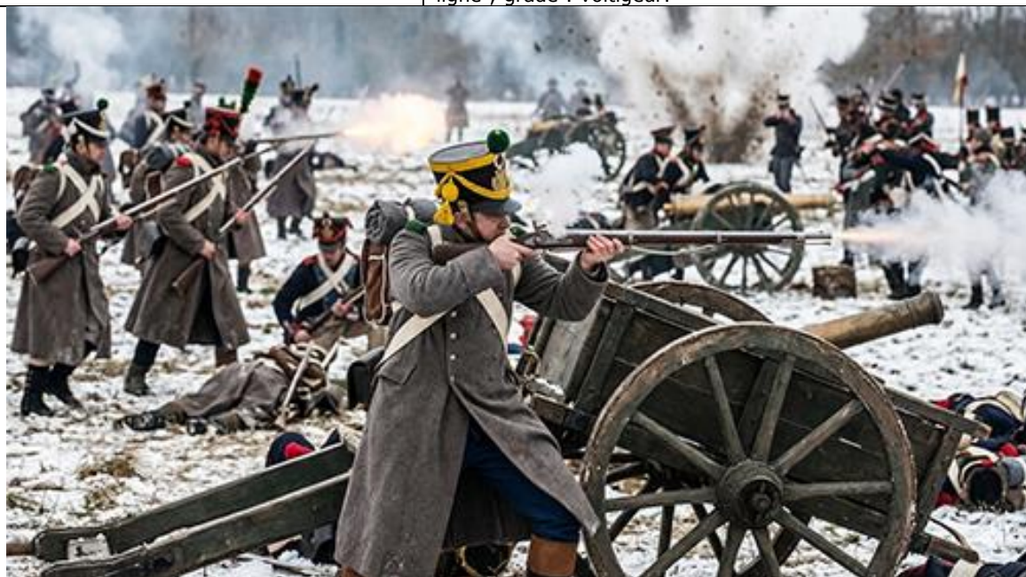
Les voltigeurs au feu.