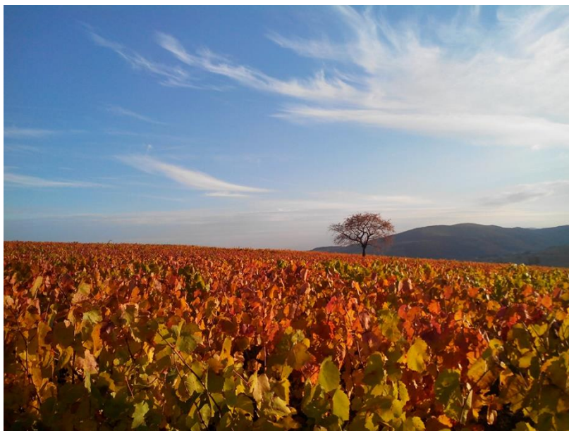
« ... une œuvre et demie de vigne à la Croix de l'arbre... »