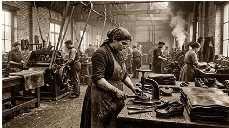
Cette caoutchoutière fabrique des chaussures.

Le caoutchoutier, ce terme n'est plus usité de nos jours, est une personne qui fabrique ou travaille le caoutchouc, souvent elle fabrique des chaussures.